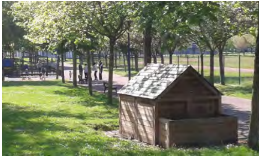
Compostadora comunitaria en Hernani

Se trata del "DECRETO 63/2019, de 9 de abril, por el que se establece el régimen jurídico y las condiciones técnicas de las instalaciones y actividades de compostaje comunitario."