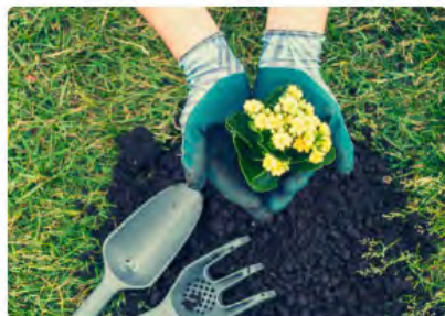
Elaboro compostaje doméstico a partir de residuos

En la cumbre no faltaron referencias al compostaje. En el siguiente enlace se pueden encontrar diversas acciones que podemos llevar a cabo entre la ciudadanía para reducir nuestro impacto en la huella de carbono. La elaboración del compost en casa, cómo no, está entre las acciones planteadas.