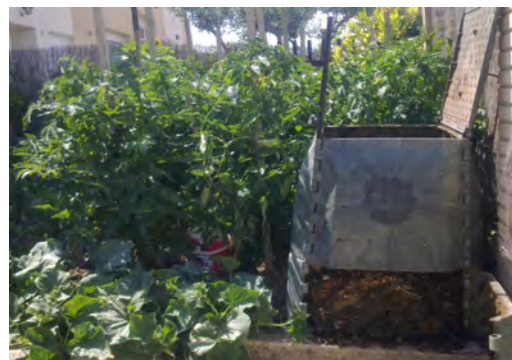
Compostador doméstico colocado en la zona de huerta de un domicilio particular

A lo largo de 2020 continuaremos con los seguimientos para garantizar el correcto estado de los compostadores repartidos. Si tienes necesidad de asesoramiento o quieres que te hagamos una visita para valorar el estado de tu compostador no dudes en ponerte en contacto con nosotros.