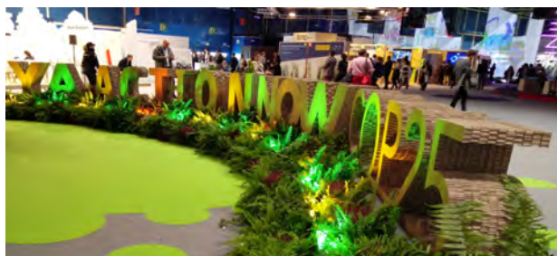
Imagen del pabellón verde de la cumbre, donde se exponen las distintas iniciativas llevadas a cabo por instituciones, asociaciones, etc.