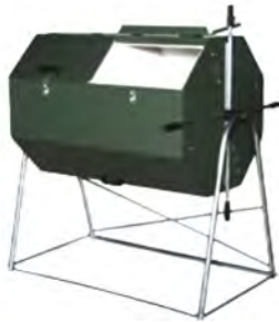
Imagen del compostador dinámico

El compost se puede hacer en montón (como siempre se ha hecho en las huertas), en compostadores caseros o en compostadores comerciales, como los que mancomunidad entrega a las familias participantes. También existen otros compostadores, los llamados dinámicos, donde todo el compostador se mueve para la aireación y homogenización de la mezcla