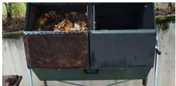
Aspecto de los dos compartimentos, uno en uso y otro no. Cuando uno se llena, se cierra y se comienza con el contiguo.