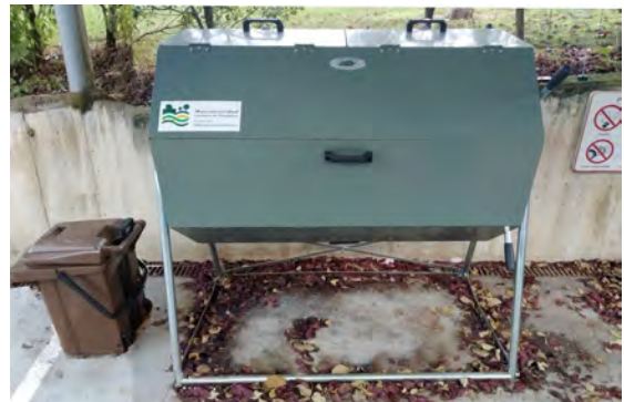
Aspecto de la instalación piloto. En el cubo de la izquierda se almacena el pellet que sirve de estructurante.