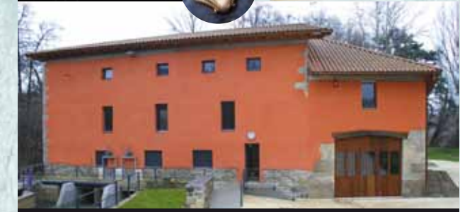
Centro de Información y Sensibilización del Parque Fluvial Ibai Parkeko Informaziorako eta Sentsibilizaziorako Zentroa