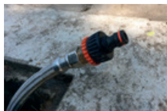
Enlace rápido de la toma de agua

(Pinchar aquí: www.mcp.es/residuos/solicitud-vasos-reutilizables-para-fiestas-y-eventos )