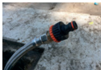
Ur-hargunearen lotura azkarra

(Click hemen: www.mcp.es/eu/hondakinak/berrerabil-daitezkeen-edalontziak-eskatu-jai-eta-ekitaldietarako )