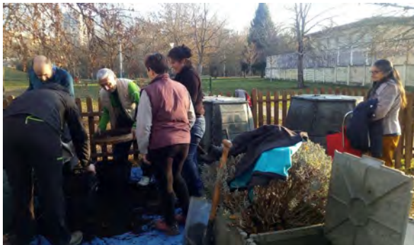
Extracción compost San Jorge-Colegio

Al no quedar espacio en las compostadoras el 16 de enero, al poco de empezar el año, se organizó la extracción. Ese día extrajimos unos 500L de un compost maduro y de gran calidad.