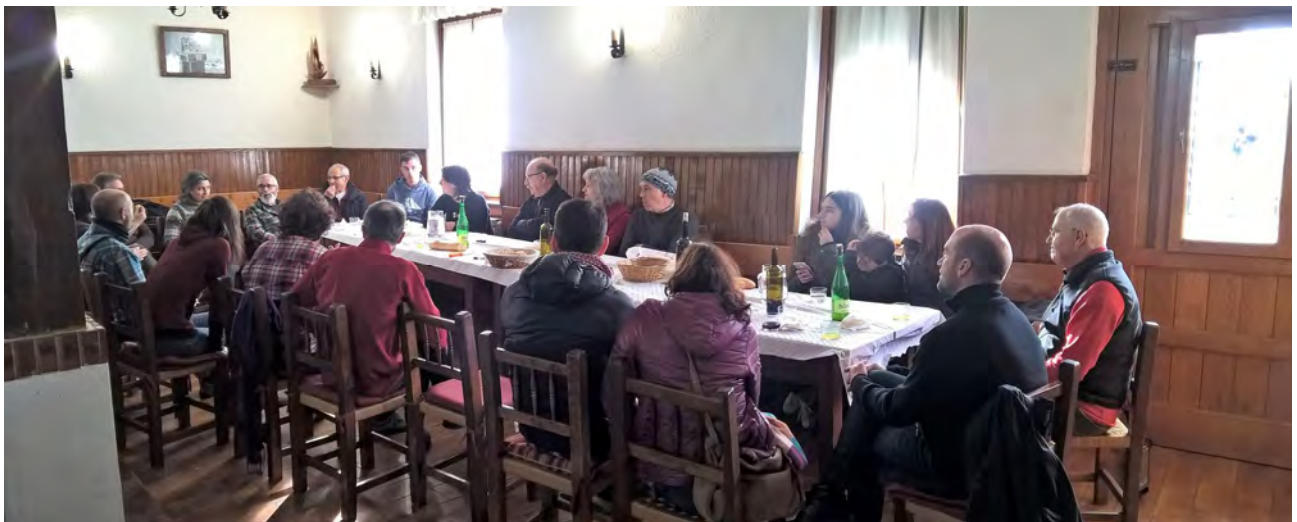
Sociedad Iratxo de Irurtzun, después de reponer fuerzas llegó el momento del coloquio

Faltó tiempo y varios temas se quedaron en el tintero para tratarlos en próximos encuentros .