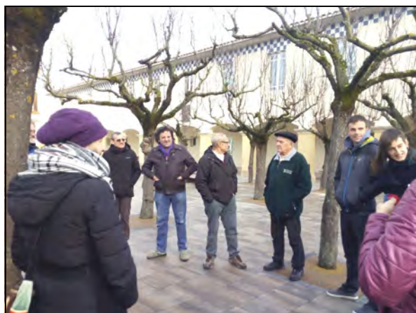
El primer contacto, el encuentro en la plaza de Irurtzun reunió a participantes de Sakana y de la Comarca de Pamplona

Tanto en la Comarca de Pamplona como en Sakana existen áreas de compostaje comunitario con personas que se encargan de las tareas de mantenimiento de forma voluntaria.