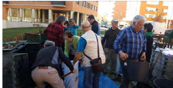
Extracción compost San Jorge-Vicenta María

No ha pasado mucho tiempo desde que se realizó la última extracción. No obstante al necesitar espacio y viendo que el material estaba maduro, se convocó a las personas usuarias el 28 de febrero para hacer la extracción de compost para huertas. Se vació un gran volumen, nada menos que 3000L con la participación 17 personas.