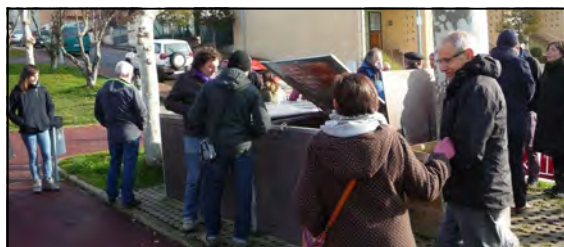
Área de la Plaza Gernika

El alcance del encuentro abarcó a 24 personas de ambas mancomunidades. Desde La Comarca de Pamplona hubo representantes del barrio de San Jorge, barrio de Mendebaldea, Larragueta y Oteiza. También hubo gente que no pudo estar y que esperamos que puedan acudir a próximos eventos.