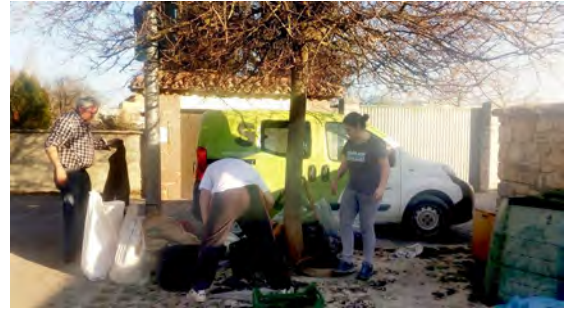
Extracción compost Huarte

La extracción de esta zona se realizó el 25 de febrero. La compostadora madura que se vació proporcionó 350L de compost maduro y bien compostado. Un material de primera que se repartió entre los dos usuarios que colaboraron en la extracción.