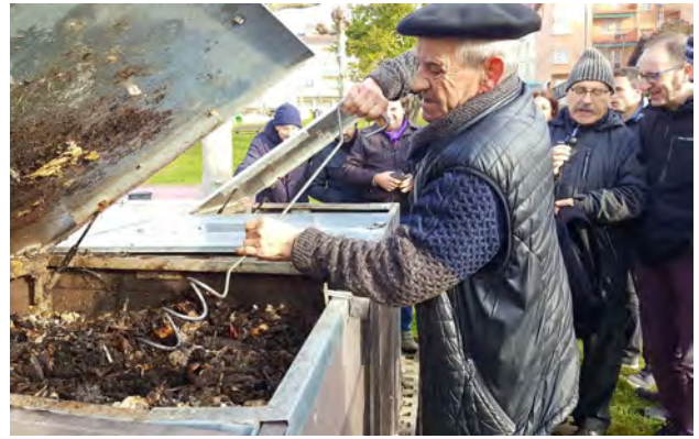
Demostración del uso del aireador . Es fundamental para obtener un buen compost